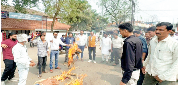
हरिभूमि न्यूज़ || सोहागपुर