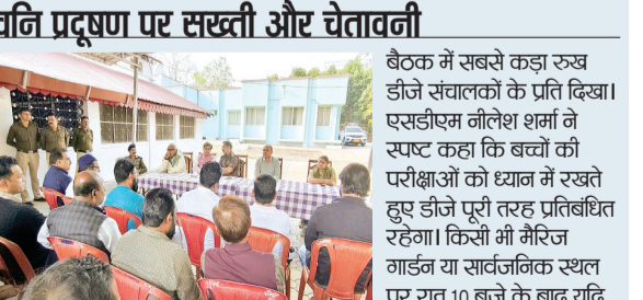
हरिभूमि न्यूज़ || इटारसी