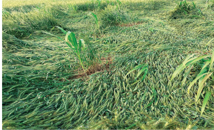
फसलों पर दिखा मौसम परिवर्तन का असर

पश्चिमी-विक्षोभ के असर से जिले में मौसम ने अचानक करवट ले ली। शनिवार को कई इलाकों में हल्की बारिश और ठंडी हवाओं से दिन के तापमान में गिरावट आई, जिससे लोगों को गर्मी से राहत मिली। हालांकि यह बदलाव अस्थायी बताया जा रहा है।