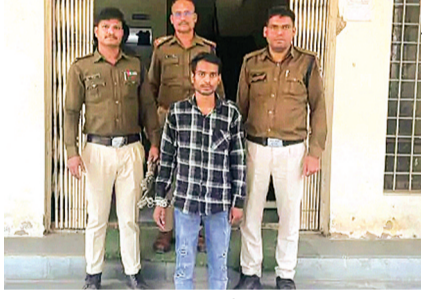
हरिभूमि न्यूज ▶▶ बैतूल