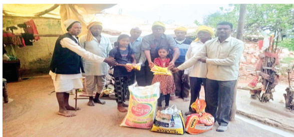
हरिभूमि न्यूज़ || इटारसी

मानवता और सेवा की एक अनूठी मिसाल पेश करते हुए आदिवासी सेवा समिति तिलक सिंदूर के कार्यक्रमों में समाज सेवा का अनुभूत उदाहरण प्रस्तुत किया है। समिति ने न केवल प्रसिद्ध तिलक सिंदूर मेले में पार्किंग व्यवस्था को सुचारू रूप से संभाला, बल्कि उससे प्राप्त आय का एक हिस्सा बेघर हुए गरीब परिवारों की सहायता के लिए दान कर दिया।