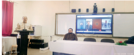
हरिभूमि न्यूज़ || सोहागपुर