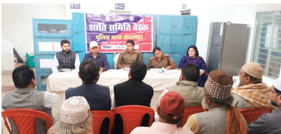
हरिभूमि न्यूज़ || सोहागपुर