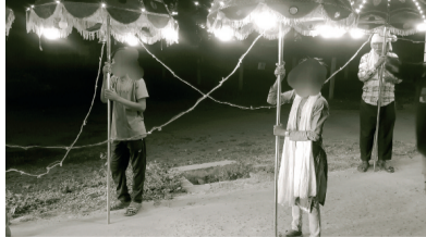
संचालित किया जाता है।

भारत में बाल श्रम पर रोक के सख्त कानून बनाए गए हैं। लेकिन मैदान पर कानूनी सख्ती ढीली नजर आती है। हमारे नर्मदापुरम जिला क्षेत्र में ही बालक बालिकाओं को श्रमिक के रूप में कार्यरत देखा जा सकता है। हरिभूमि ने मामले में नर्मदापुरम जिला क्षेत्र में पिछले एक सप्ताह में नजर रखी। तो पाया कि इन दिनों वैवाहिक कार्यों में सर्वाधिक बाल श्रमिक संलग्न हैं। बारातों में छोटे-छोटे बच्चों को बंड बाजे के साथ कार्य करते अथवा बारात में दूल्हे के आसपास रोशनी करती लाइट्स के छाते थामे चलते देखा जा सकता है। जिले का ऐसा कोई भी बड़ा या मध्यम शहर या कस्बा नहीं छोटा जहां बारातों में बाल या किशोर श्रमिक न हों। रेस्टोरेन्ट, ढाबे, गैरेज, होटल पर 18 वर्ष से कम आयु के बच्चों को श्रमिक के रूप में कार्य करते देखा जा सकता है। लेकिन कार्रवाई के नाम पर प्रशासन की ओर से मात्र जागरूकता सप्ताह