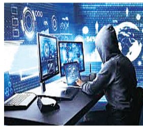
हरिभूमि न्यूज ▶▶ बैतूल

जिले में साइबर अपराधों की रोकथाम एवं प्रभावी नियंत्रण के लिए पुलिस अधीक्षक बैतूल वीरेंद्र जैन के निर्देशन तथा अतिरिक्त पुलिस अधीक्षक कमला जोशी के मार्गदर्शन में निरंतर कार्यवाही की जा रही है। इसी क्रम में उनके मार्गदर्शन में जिले के विभिन्न थाना क्षेत्रों में 24 घंटे के अंदर 11 साइबर अपराध के प्रकरण दर्ज किए गए हैं। साथ ही ई-जरी एफआईआर प्रणाली के माध्यम से कुल 17 प्रकरण पंजीबद्ध कर संबंधित थाना क्षेत्रों को अत्रिभित कर विधि अनुसार शुरू की गई है।